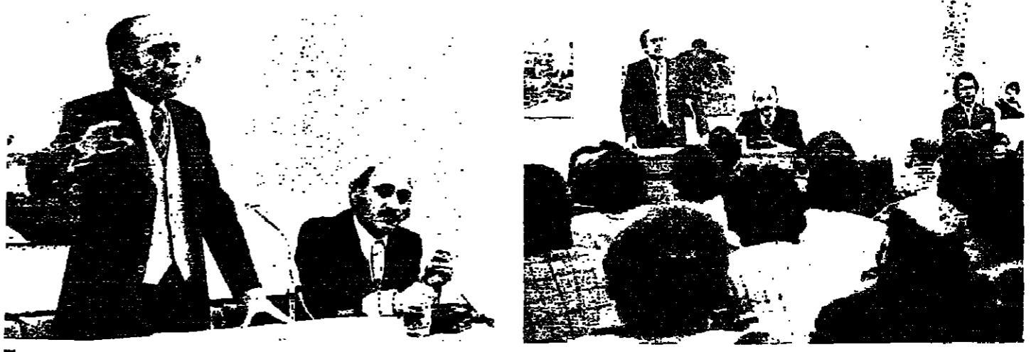
جمهور أمسية النادي الثقافي العراقي

بسم فريضة: مشكلة العالم العربي هي الإدارة... وفيما يتعلق بالمشكلة التي نعالجها في هذه المجلدات المتخصصة بشؤون الإدارة التي تصدر في ارضي المصنوع والمؤسسات المتخصصة في أوروبا واليابان والولايات المتحدة، كما وانها ستفي، عن كتاب، وبشكل واضح الإدارة في البلاد العربية والتي تصبغ بين الجانب النظري والتطبيقات الواقعية، هادفة من ذلك ان تقدم للمسؤولين الاداريين ورجال التقنية ما ينتج لهم التعرف الى واقع الادارة ومستقبلها واحتياجاتها.